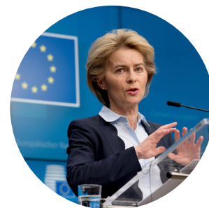
La présidente von der Leyen, discours sur l'état de l'Union 2020

“Où est l'essence de l'humanité lorsque, tous les jours, des Roms sont exclus de la société et que d'autres personnes sont repoussées simplement à cause de leur couleur de peau ou de leurs croyances religieuses?”