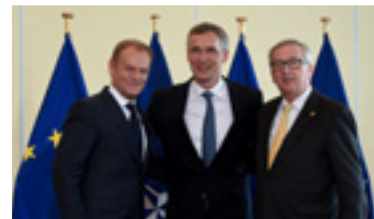
(NATO) samits Varšavā 2016. gada 8. un 9. jūlijā

2016. gada 8. jūlijā priekšsēdētāji D. Tusks un Ž. K. Junkers un NATO ģenerālsekretārs Stoltenbergs parakstīja kopīgu deklarāciju, lai dotu jaunu impulsu un saturu ES un NATO stratēģiskajai partnerībai , un iezīmēja septiņas konkrētas jomas, kurās jāuzlabo sadarbība . Sadarbība ir kļuvusi par vispārpieņemtu normu, un tas ir kopīgās deklarācijas jaunā vērienīguma līmeņa tiešs rezultāts.