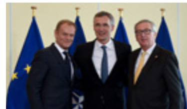
Summit NATO, Varšava, 8.–9.7.2016

Předsedové Juncker a Tusk a generální tajemník NATO Stoltenberg podepsali 8. července 2016 společné prohlášení, které do strategického partnerství EU a NATO vneslo nový impuls a zdůraznilo jeho význam a zároveň nastínilo sedm konkrétních oblastí zájmu . V přímé návaznosti na ambiciózní společné prohlášení se spolupráce stala běžnou normou.