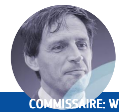
COMMISSAIRE: WOPKE HOEKSTRA