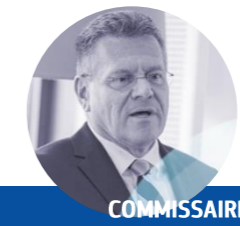
COMMISSAIRE : MAROŠ ŠEFCOVIČ