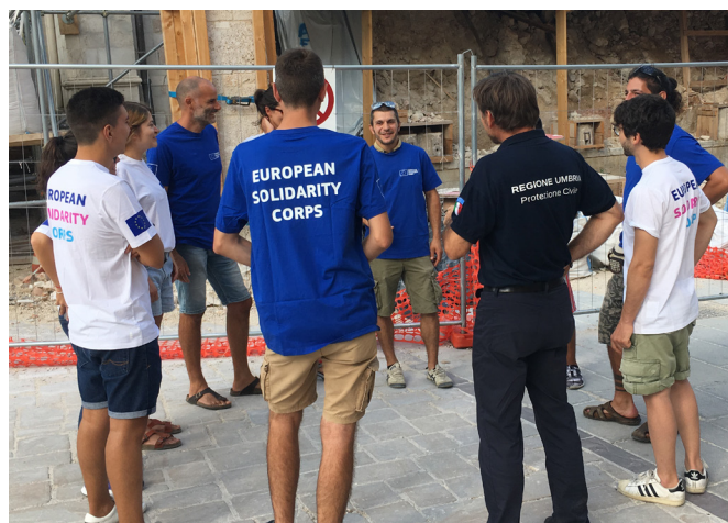
Varstvo kulturne dediščine v italijanski Norciji septembra 2017

V letih 2017 in 2018 so številni prostovoljci iz vse Evrope sodelovali v treh različnih projektih evropske solidarnostne enote v osrednji Italiji, v okviru katerih so pomagali pri varstvu in krepitvi materialne in nematerialne dediščine v regijah, ki so jih leta 2016 prizadeli uničujoči potresi.