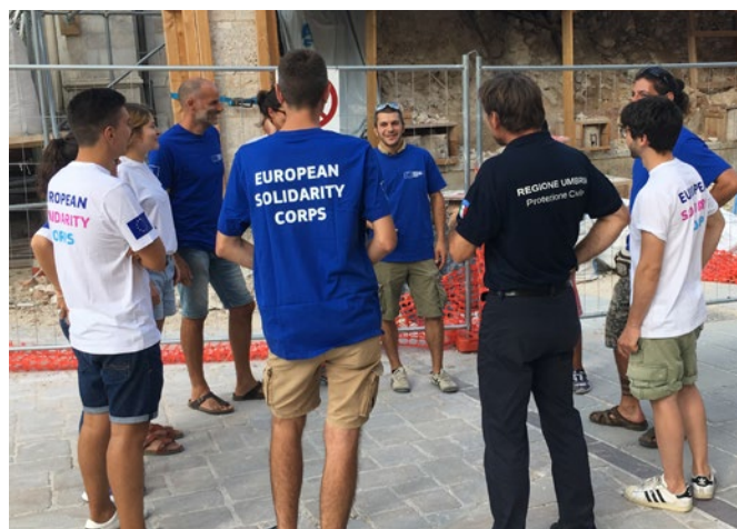
Помощ за опазване на културното наследство, Норча, Италия, септември 2017 г.

Между 2017 г. и 2018 г. по линия на корпуса за солидарност доброволци от цяла Европа са участници в три различни проекта в Централна Италия в помощ на защитата и укрепването на материалното и нематериалното наследство в регионите, засегнати от опустошителните земетресения през 2016 г.