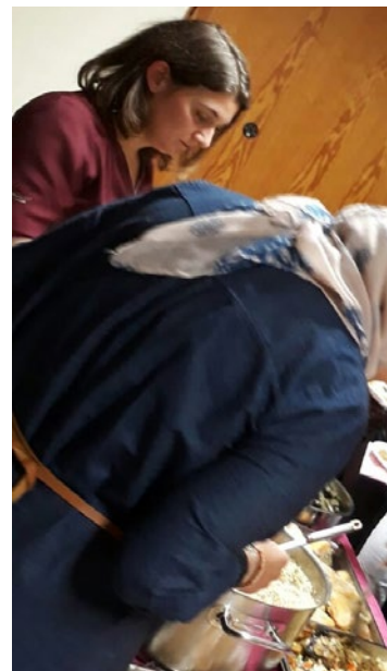
Доброволческа дейност в център за търсещи убежище лица, Юпен, Белгия, юни 2018 г.