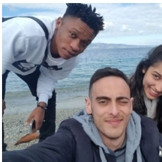
Помощ за търсещите убежище лица, Ренде, Италия, февруари 2018 г.