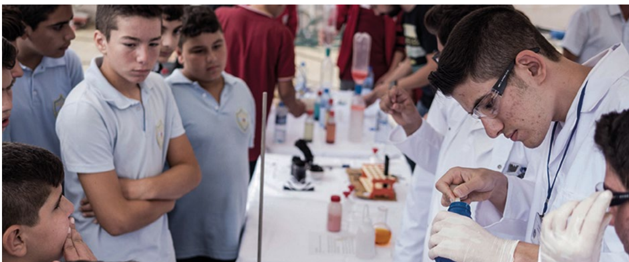
Πρακτικές επιδείξεις επιστημονικών πειραμάτων από τους μαθητές στη διάρκεια της Ευρωπαϊκής Έκθεσης Ερευνητών που οργανώθηκε από το Ευρωπαϊκό Γραφείο Ενημέρωσης και Πληροφόρησης EU InfoPoint.

«Αυτό που κάνει η ΕΕ εδώ είναι μια επένδυση για το μέλλον – επειδή εμείς είμαστε το μέλλον», λέει η Doğa.