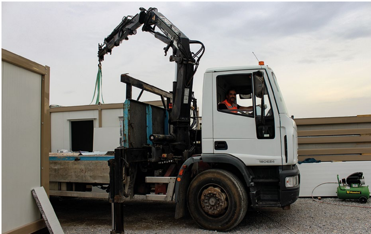
Χειριστές ανυψωτικών οχημάτων αναπτύσσουν τις πρακτικές τους γνώσεις στο πλαίσιο του έργου με την ονομασία Lifting the Operators Up.

Για παράδειγμα, αρχιτέκτονες στην τουρκοκυπριακή κοινότητα εκπόνησαν ένα πρόγραμμα συνεχούς επαγγελματικής κατάρτισης αξιοποιώντας Ευρωπαϊκά κονδύλια.