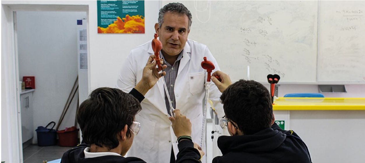
Μαθητές κατά τη διάρκεια μαθήματος χημείας σε σχολείο της μέσης εκπαίδευσης.

Χάρη στο έργο αυτό τα επιστημονικά εργαστήρια σε σχολεία της τουρκοκυπριακής κοινότητας έχουν ευθυγραμμιστεί με τα Ευρωπαϊκά πρότυπα. Η μελλοντική στήριξη από την ΕΕ θα επικεντρωθεί στην αναβάθμιση των εργαστηρίων σε όλα τα σχολεία της κοινότητας.