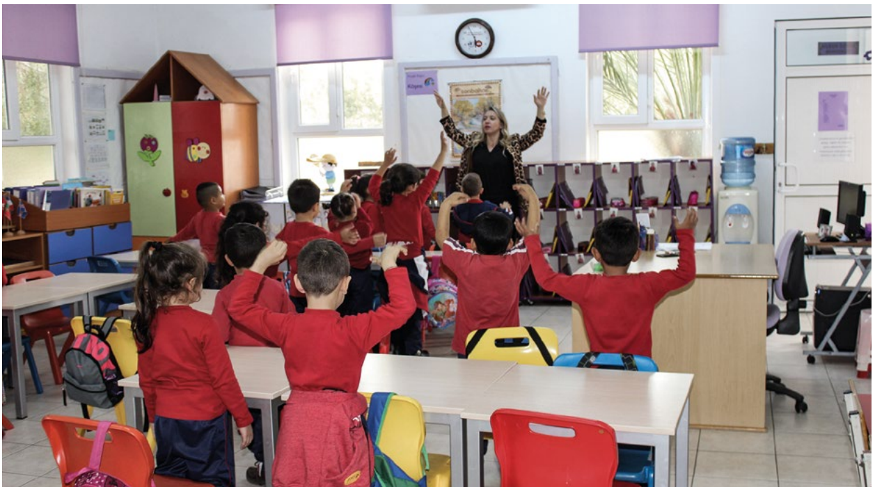
Παιδιά κατά τη διάρκεια μαθήματος σε δημοτικό σχολείο της Λευκωσίας στο οποίο εφαρμόζεται μια νέα παιδοκεντρική μέθοδος.