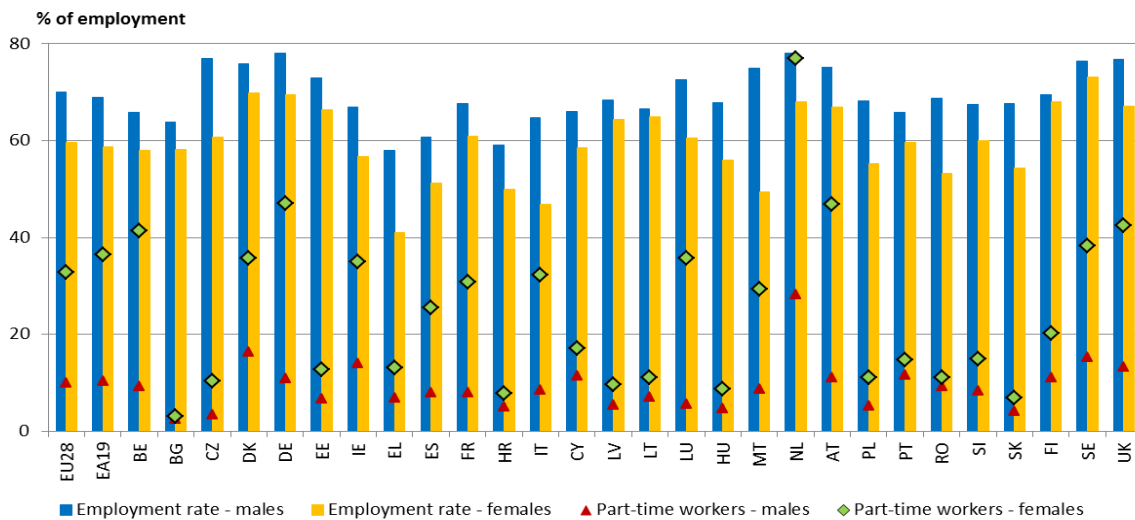
Abbildung 1: Beschäftigungsquoten nach Geschlecht, 15- bis 64-Jährige, 2014

Frauen sind auch oft in Branchen und Arbeitsplätzen mit niedriger Produktivität, geringer Qualifikation und schlechter Bezahlung gefangen und sind bei befristeter Beschäftigung überrepräsentiert. Viele Frauen üben Tätigkeiten aus, für die sie überqualifiziert sind. Außerdem weisen sie das am geringsten genutzte unternehmerische Potenzial auf, denn nur 29 % aller Unternehmer sind weiblich.