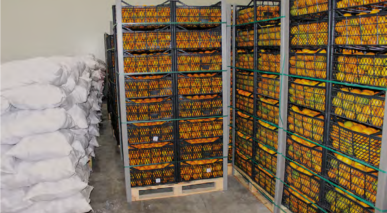
Πορτοκάλια σε αποθήκες Τουρκοκυπρίων παραγωγών εσπεριδοειδών

Τα εσπεριδοειδή θα μπορούσαν να αξιοποιηθούν περισσότερο στο εμπόριο εκατέρωθεν της Πράσινης Γραμμής στην Κύπρο. Παρόλο που το ζεστό κλίμα της ανατολικής Μεσογείου στην Κύπρο είναι το κατάλληλο για την παραγωγή εσπεριδοειδών, οι ασθένειες των εσπεριδοειδών είναι σχετικά συχνές, πράγμα που σημαίνει ότι είναι σημαντική η συμμόρφωση με τα πρότυπα της ΕΕ στις διαδικασίες παραγωγής.