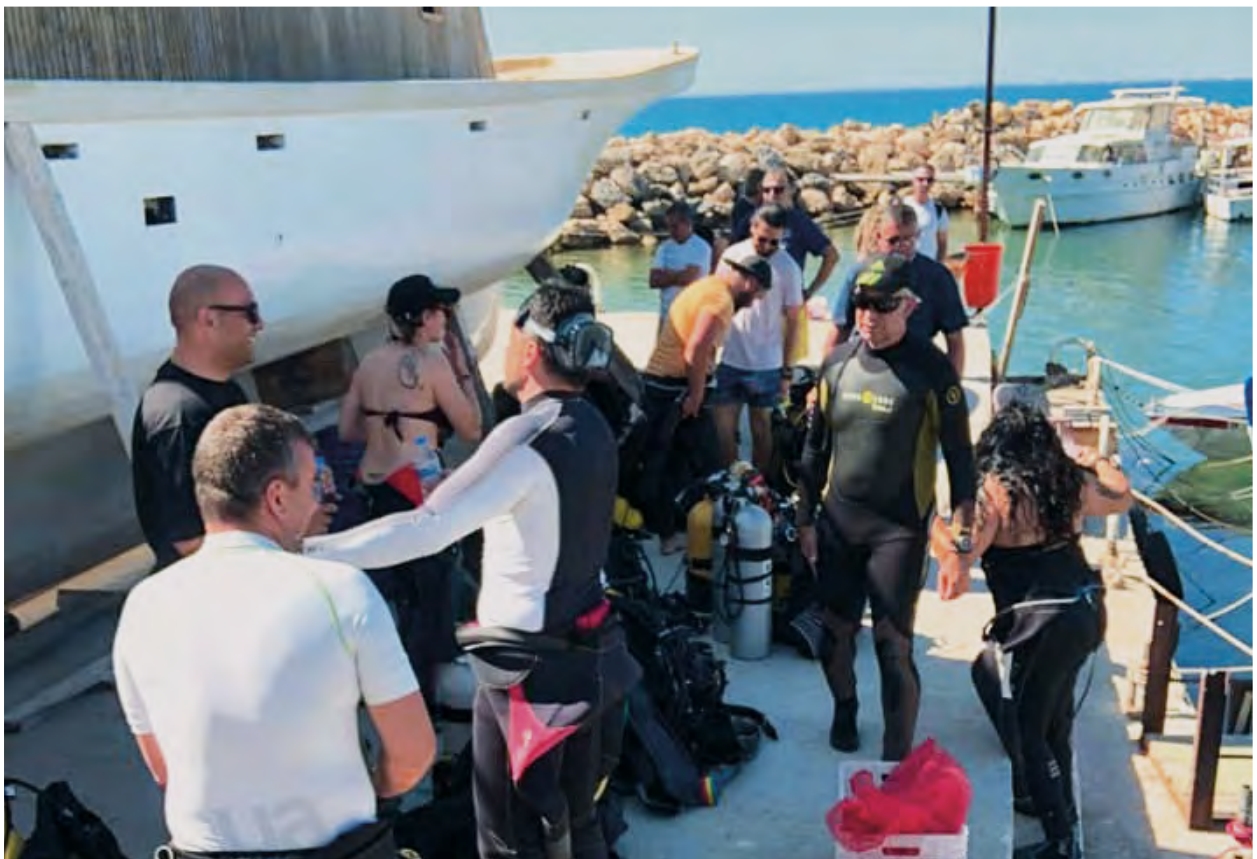
Δύτες από τις δύο κοινότητες μετά το πέρας του καθαρισμού ακτής

Το έργο στοχεύει στη συμμετοχή τουλάχιστον 125 παράκτιων επιχειρήσεων, 150 ψαράδων, 11 τοπικών κοινοτήτων καθώς και σχολείων.