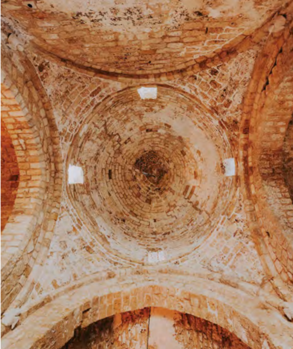
Η αναστήλωση μνημείων, όπως της Εκκλησίας του Αρχαγγέλου Μιχαήλ, βοήθησε στην επαναπροσέγγιση Κυπρίων από τις δύο κοινότητες

Εκτός από την κατάρτιση και την απόκτηση δεξιοτήτων, ένας κάπως διαφορετικός τομέας, στον οποίο η στήριξη της ΕΕ συμβάλλει στην οικοδόμηση σχέσεων ανάμεσα στις δύο κοινότητες, είναι η διατήρηση της πολιτιστικής κληρονομιάς.