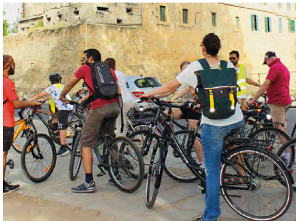
Δικονομική ποδηλασία που οργανώθηκε από τον CABS: Ανακαλύπτοντας τους 11 προμαχώνες της Λευκωσίας

Η κοινή κληρονομιά είναι το επίκεντρο του ενδιαφέροντος και του οργανισμού Cyclists Across Barriers - Ποδηλάτες Χωρίς Σύνορα (CABS). Αυτός ο μη-κερδοσκοπικός οργανισμός, ο οποίος ιδρύθηκε το 2012, προάγει την ποδηλασία ως μέσο εξάλειψης φραγμών όλων των τύπων: μπορεί να πρόκειται για φυσικούς φραγμούς ή ακόμα και για συναισθηματικούς ή ψυχολογικούς φραγμούς. Στην περίπτωση της Πράσινης Γραμμής μπορεί να είναι και τα δύο.