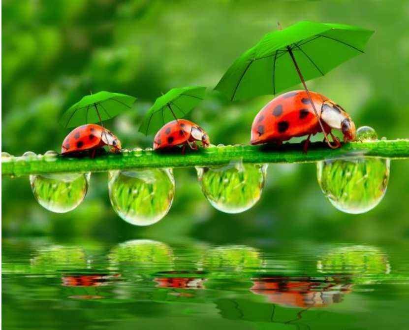
Pariisissa vuonna 2015 järjestetyssä

ilmastonmuutoskonferenssissa EU muodosti kumppaneidensa kanssa laajan ja erittäin kunnianhimoisen liittouman, jonka työ johti Pariisin sopimukseen. Sopimuksessa vahvistetaan maailmanlaajuinen toimintasuunnitelma, jonka tarkoituksena on se, että maailma välttää vaarallisen ilmastonmuutoksen. Pariisin sopimuksen täytäntöön panemiseksi komissio on ehdottanut kunnianhimoisia, koko taloutta koskevia tavoitteita, joilla pyritään pienentämään EU:n kasvihuonekaasupäästöjä vuoteen 2030 mennessä siten, että ne ovat vähintään 40 prosenttia pienemmät kuin vuoden 1990 päästötaso. Näiden tavoitteiden saavuttamiseksi on tärkeää, että voimassa oleva ilmastolainsäädäntö pannaan täysimääräisesti täytäntöön ja sen täytäntöönpanoa valvotaan tarkasti.