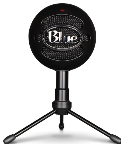
Blue Snowball nastavljen na kardiodni vzorec