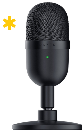
Razer Seiren Mini