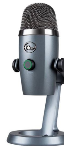
Blue Yeti Nano nastavljen na kardiodni vzorec