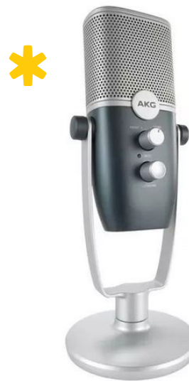
AKG ARA nastavljen na kardiodni vzorec