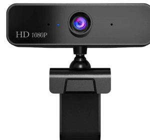
Mikrofona, vgrajenega v spletno kamero