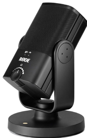
Enosmerni namizni mikrofona s priključkom USB 125Hz - 15000Hz