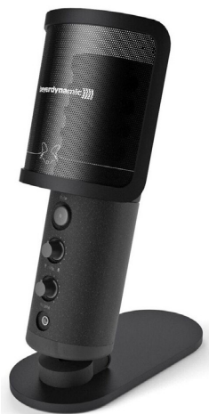
Beyerdynamic FOX nastavljen na večjo občutljivost (high gain)