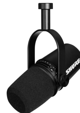
Shure MV7 s stojalom ali trinožnikom

* najboljše opremljeni (stojalo, blažilnik tresljajev) in enostavni za uporabo (prilagajanje vzorcev)