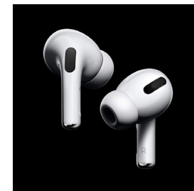
Bezdrôtové slúchadlá do uší pripojené cez Bluetooth