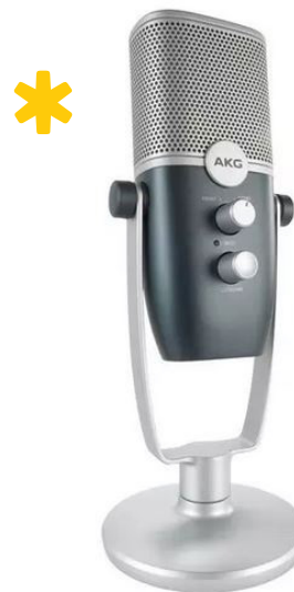
AKG ARA com padrão cardióide