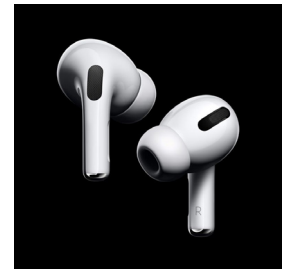
Auriculares Bluetooth sem fios