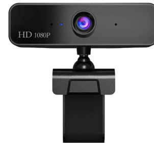
Auscultadores de microfone da câmara Web