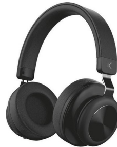
Bluetooth sem fios