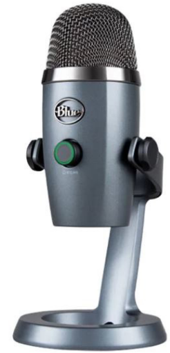
Blue Yeti Nano bl-użu ta' mudell kardjoji