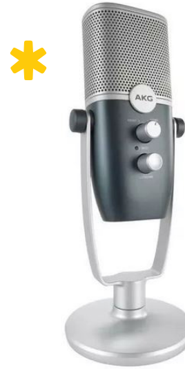
AKG ARA bl-użu ta' patter kardjoji