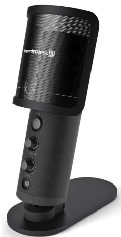
Beyerdynamic FOX su plataus signalo spektru (angl. high-gain) funkcija