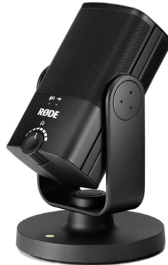
Vienakryptis darbastalio mikrofonas su USB jungtimi 125Hz - 15000Hz