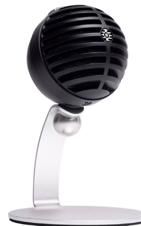
Shure MV5 con impostazione neutra