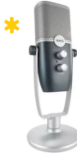
AKG ARA kardioid mintát használ