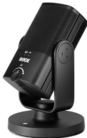
Egyirányú USB csatlakozós asztali mikrofon 125Hz - 15000Hz