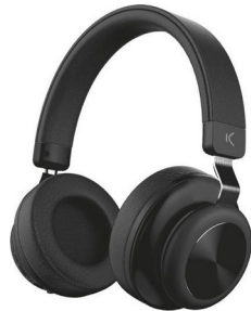
Vezeték nélküli Bluetooth-os fejhallgató