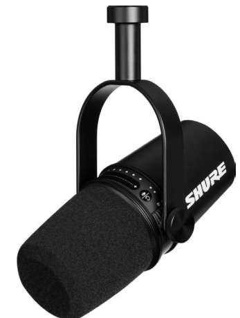
Shure MV7 + mikrofon állvány / háromlábú állvány

* A legjobb kiegészítőket is tartalmazzák (mikrofon állvány, mikrofon kengyel), nagyon felhasználóbarát eszközök (hangminta kapcsoló)