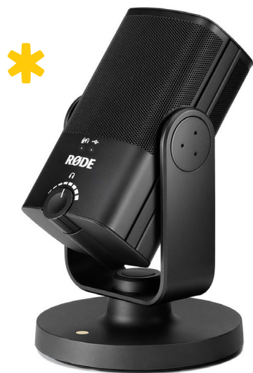
Rode NT USB Mini