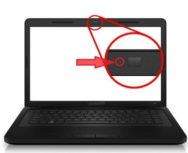
Kannettavan tietokoneen mikrofoni