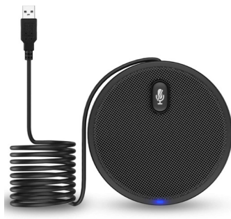
Pallomikrofoni (eli monisuuntainen)