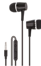
Kuulokkeet, joiden johdossa on mikrofoni