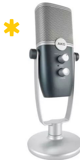
AKG ARA s kardioidním vzorem