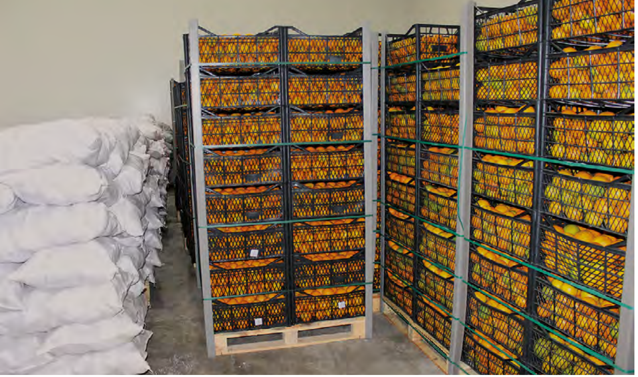
Kıbrıslı Türk narenciye üreticileri tarafından depolanan portakallar.

Narenciye'nin Kıbrıs'taki Yeşil Hat ticareti açısından henüz değerlendirilmemiş bir potansiyeli var. Kıbrıs'ın ılık doğu Akdeniz iklimi narenciye üretimi için uygun, ancak hastalıklar da nispeten yaygın. Bu nedenle üretim süreçlerinin AB standartlarına uygun olması önemli.