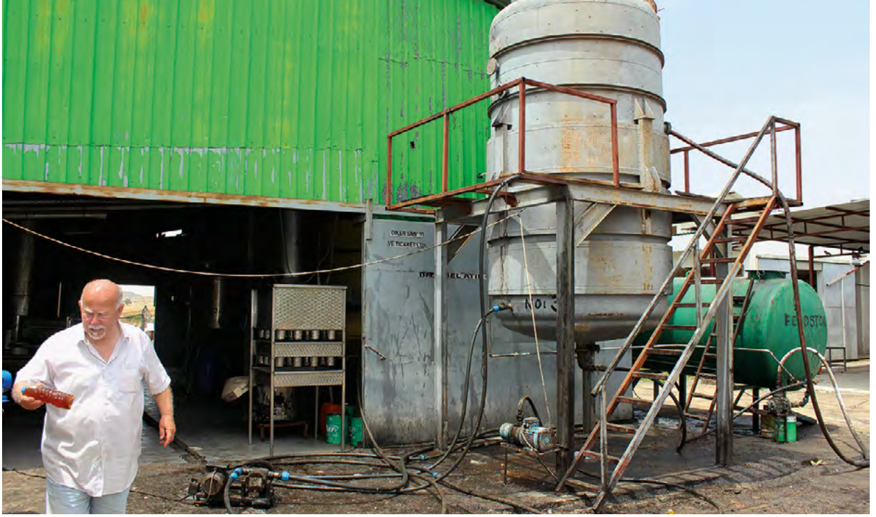
Hüseyin atık bitkisel yağların işlendiği tesiste.

Hüseyin Diner'in yaptığı iş de gıda sektörü ile alakalı. Buna rağmen piyasada epeyce benzersiz bir boşluk bulmayı başarmış.