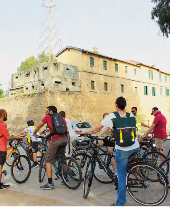
CABS'ın düzenlediği iki toplumlu bisiklet turu: Lefkoşa'nın 11 burcunun keşfi.

"Cyclists Across Barriers"ın (CABS) (Engelleri Aşan Bisikletçiler), de odak noktası ortak miras. 2012 yılında başlamış olan kâr amacı gütmeyen bu organizasyon bisiklet sürmeyi her türlü bariyeri aşmakta bir araç olarak teşvik ediyor. Bunlar fiziksel ya da daha fazla duygusal veya psikolojik bariyerler olabilirler. Yeşil Hat söz konusu olduğunda ise her ikisi de geçerlidir.