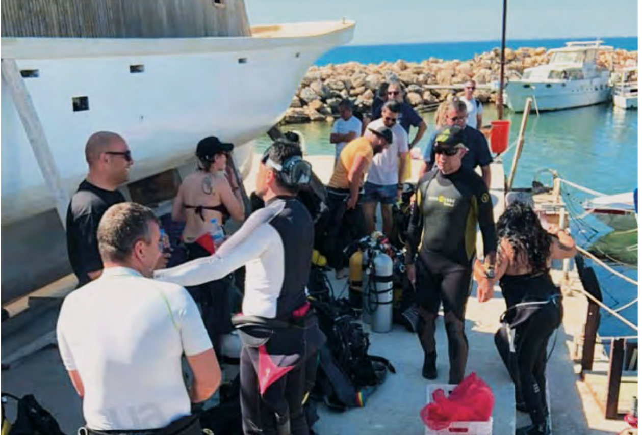
Bir sahil temizliğinin ardından iki toplumdan dalgıçlar.

Proje en az 125 kıyı işletmesi, 150 balıkçı, 11 yerel topluluk ve okulu sürece dahil etmeyi amaçlıyor.