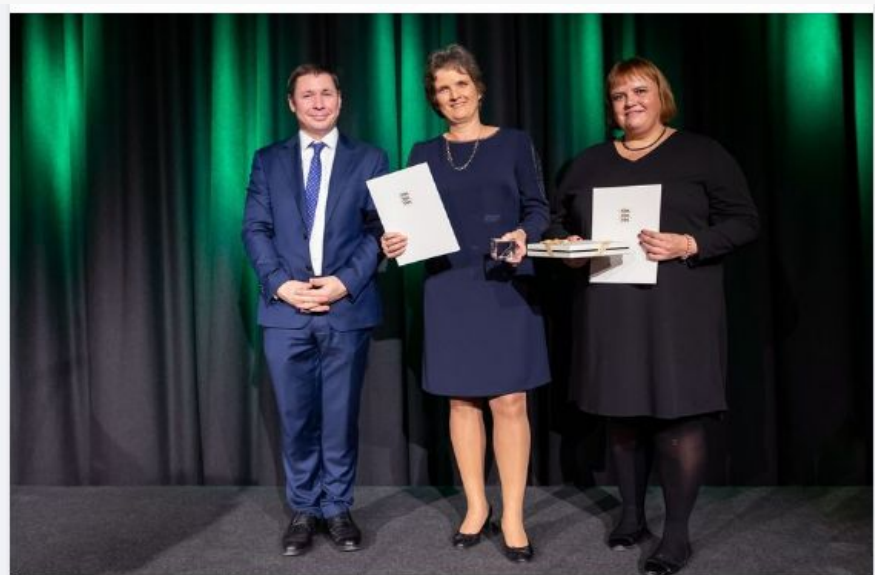
Registrite ja Infosüsteemide Keskus

Best ICT project of the year in the Ministry of Justice