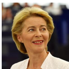
Ursula von der Leyen

Europejski plan działania prowadzący do zniesienia środków powstrzymujących rozprzestrzenianie się COVID-19, przedstawiony przez przewodniczącą Komisji Europejskiej i przewodniczącego Rady Europejskiej, stanowi odpowiedź na wezwanie członków Rady Europejskiej do opracowania strategii wyjścia, która będzie skoordynowana z państwami członkowskimi i która przygotowuje grunt pod kompleksowy plan naprawy i bezprecedensowe inwestycje.