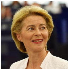
Ursula von der Leyen

Az Európai Bizottság elnöke és az Európai Tanács elnöke által itt előterjesztett közlemény az Európai Tanács tagjainak felszólítására válaszol, amely egy olyan, a tagállamok között összehangolt exitstratégiát szorgalmaz, amely átfogó gazdaságélénkítési tervet és soha nem látott mértékű beruházásokat készít elő.