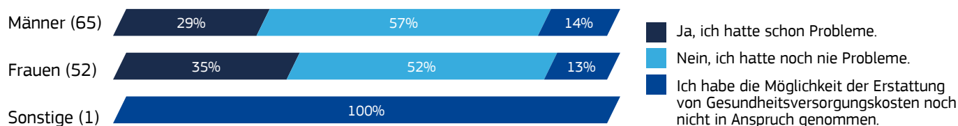
Abbildung 4 : Erfahrungen und Probleme mit der grenzüberschreitenden Erstattung von Gesundheitsversorgungskosten

Stellungnahmen: 240