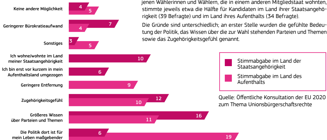
Abbildung 3: Gründe für die Stimmabgabe im Aufenthaltsland oder im Land der Staatsangehörigkeit (Anzahl Befragte)

85 % der Befragten haben bei der letzten Wahl zum Europaparlament im Jahr 2019 ihre Stimme abgegeben. Knapp 70 % von ihnen wohnte in ihrem Herkunftsland, knapp ein Drittel in einem anderen EU-Mitgliedstaat. Von jenen Wählerinnen und Wählern, die in einem anderen Mitgliedstaat wohnten, stimmte jeweils etwa die Hälfte für Kandidaten im Land ihrer Staatsangehörigkeit (39 Befragte) und im Land ihres Aufenthalts (34 Befragte).