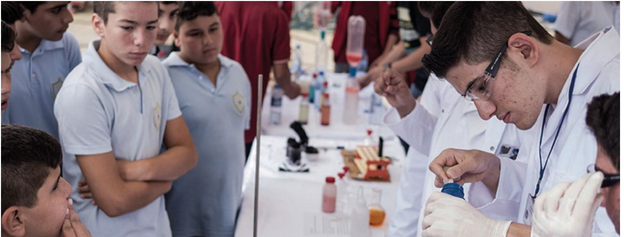
AB Bilgi Merkezi'nin düzenlediği Avrupa Araştırmacılar Günü'nde öğrenciler öncülüğünde yapılan fen uygulamaları.

Doğa, 'AB'nin burada yaptığı geleceğe yatırım yapmak, çünkü biz geleceğiz' diyor.