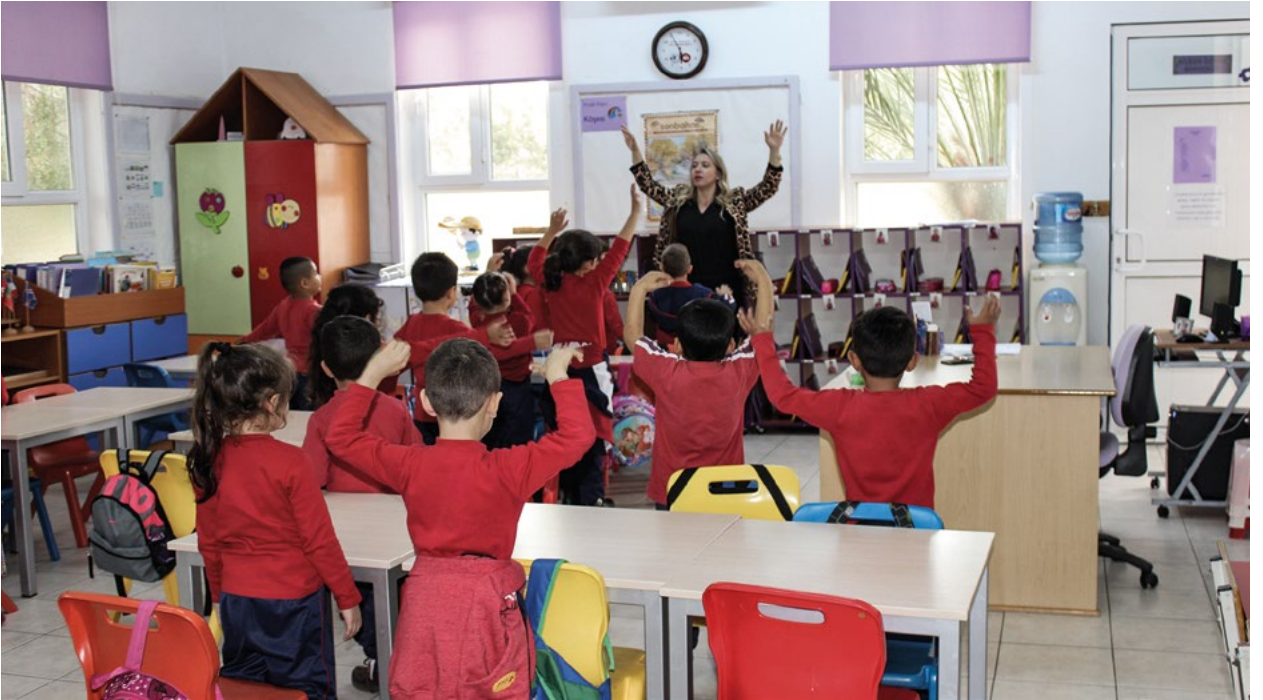
Lefkoşa'da çocuk merkezli yöntemi uygulamaya başlayan bir anaokulunda öğrenim gören çocuklar.