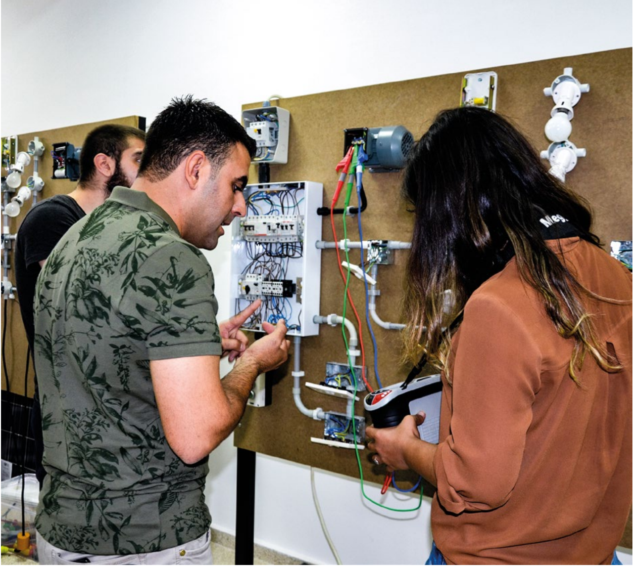
Kıbrıslı Türk elektrikçiler iki toplumlu Elektriksel Alan Projesi'nin bir parçası olarak profesyonel eğitim alıyorlar.

“ İşimde artık kendime çok daha fazla güveniyorum. ”