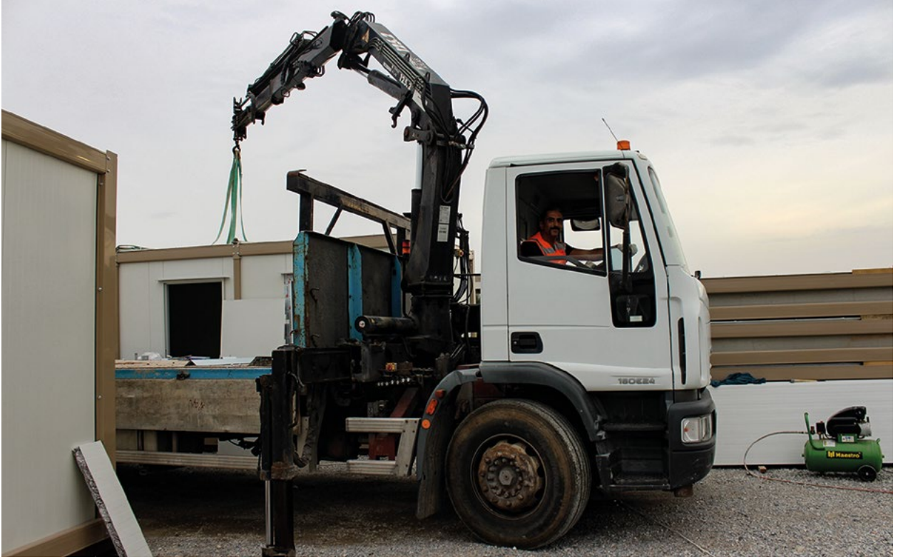
Kaldırma cihazı operatörleri, Kaldırma Cihazı Operatörlerinin eğitimi projesinin bir parçası olarak pratik bilgilerini geliştiriyorlar.

Örneğin, Kıbrıs Türk toplumundaki mimarlar, AB finansmanı ile geliştirdikleri bir dizi sürekli mesleki gelişim programını uygulamaya koydular.