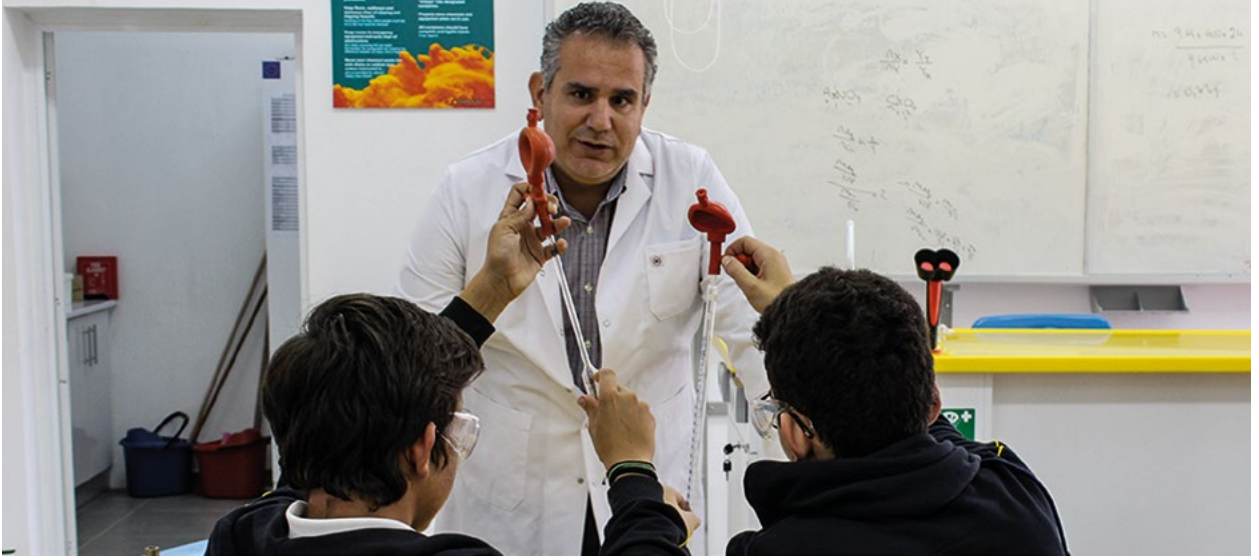
Bir ortaöğretim kurumunda kimya dersi yapan öğrenciler.

Bu projeye Kıbrıs Türk toplumundaki okullarda fen laboratuvarları AB standartlarına uygun hale getirildi. İleride verilecek AB desteği toplumdaki tüm okulların laboratuvarlarının daha iyi duruma getirilmesine odaklanacak.